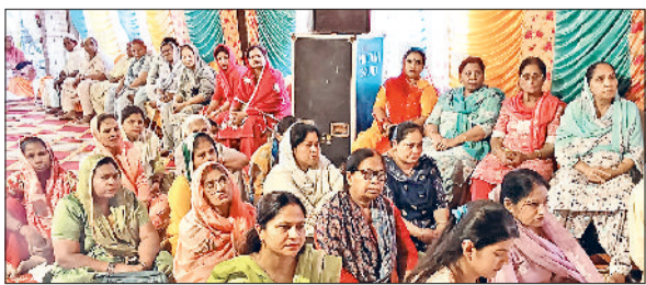
अंबाला। कथा में मौजूद महिला श्रद्धालु।