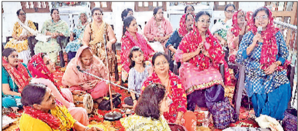
यमुनानगर। कार्यक्रम में मौजूद श्रद्धालु।

पौराणिक वृत्तान्तों के अनुसार उनका जन्म महर्षि भृगु के पुत्र महर्षि जमदग्नि द्वारा सम्पन्न पुत्रोत्त यज्ञ से प्रसन्न देवराज इन्द्र के वरदान स्वरूप पत्नी रेणुका के गर्भ से वैशाख शुक्ल तृतीया को मध्यप्रदेश के इंदौर जिला में ग्राम मानपुर के जानापाव पर्वत में हुआ था। उन्होंने कहा कि वे भगवान