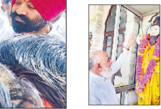
ओंकार महायज्ञ एवं विशाल मंडारे के साथ बड़े हर्षोल्लास के साथ मनाया गया। ओंकार महायज्ञ में पूजाहृति कुरड़ी वाले महाराजश्री द्वारा डाली गई। इस अवसर पर भगवान श्रीपरशुराम के स्वरूप को गंगाजल से स्नान कराकर सुंदर वस्त्रों से सुसज्जित किया गया। कीर्तन में गुरु-भजनों एवं श्रीपरशुराम जी की जीवन शैली का वर्णन कर परोपकार की भावना को संवर्धित किया गया। इस अवसर पर कुरड़ी वाले महाराजश्री ने प्रेरणा दी कि- हमारे हृदय में भगवान श्रीपरशुराम जी की परोपकार की भावना जागृत होनी चाहिए ताकि वसुधैव कुटुम्बम की भावना सार्थक हो।

कुरुक्षेत्र। जय ओंकार अंतरराष्ट्रीय सेवाश्रम संघ की ओर से श्री बहमा मंदिर प्रांगण में स्थित भगवान श्रीपरशुराम मंदिर में अक्षय-तृतीया जयन्ती महापर्व