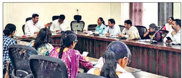
यमुनानगर। जिला परिषद कार्यालय में आयोजित स्वयं गणना प्रशिक्षण शिविर में भाग लेते हुए अधिकारी।