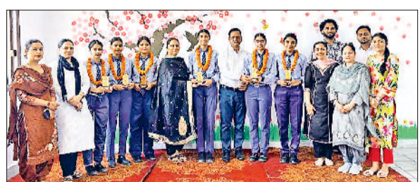
रादेर। शहीद भगत सिंह पब्लिक स्कूल में आयोजित सम्मान समारोह में मेधावी विद्यार्थियों को सम्मानित करते स्टाफ सदस्य।

चिंता सताने लगी। वे उसकी तलाश में निकले, लेकिन काफी तलाश करने के बाद भी उसकी लड़की का कुछ भी पता नहीं चला। लोगों से पूछताछ करने के दौरान उन्हें मालूम हुआ कि उसकी लड़की को गांव का ही काका शादी का झांसा देकर अगवा करके ले गया है। उसने आरोपी के खिलाफ पुलिस में शिकायत दी। पुलिस ने मामले की जांच के बाद आरोपी के खिलाफ केस दर्ज कर कार्रवाई शुरू कर दी।