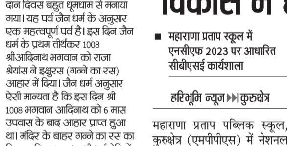
हरिभूमि न्यूज | कुरुक्षेत्र

महाराणा प्रताप पब्लिक स्कूल, कुरुक्षेत्र (एमपीपीएस) में नेशनल करिकुलम फ्रेमवर्क फॉर स्कूल एजुकेशन (एनसीएफ) 2023 पर आधारित एक दिवसीय सीबीएसई क्षमता निर्माण कार्यक्रम का भव्य आयोजन किया गया। इस कार्यशाला में विद्यालय के 60 सर्वप्रथम शिक्षकों ने बड़े उत्साह के साथ भाग लिया। कार्यक्रम का शुभारंभ पारंपरिक दीप प्रचलन